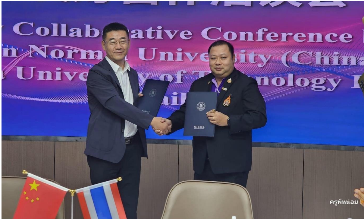
ภาพกิจกรรมที่ Anshan Normal University (ANU)