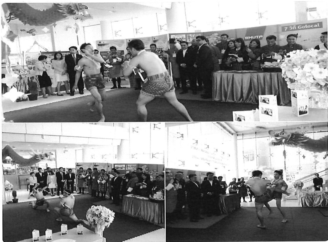
RUB 20 Jan 20